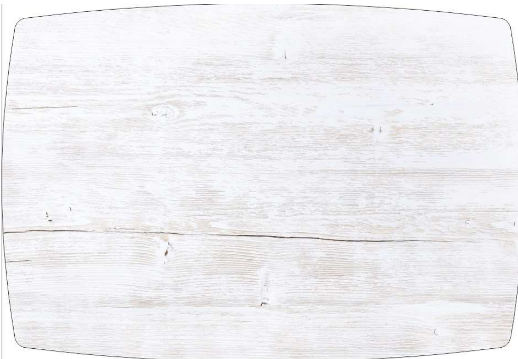
Рисунок 2: СВЕТЛОЕ ДЕРЕВО