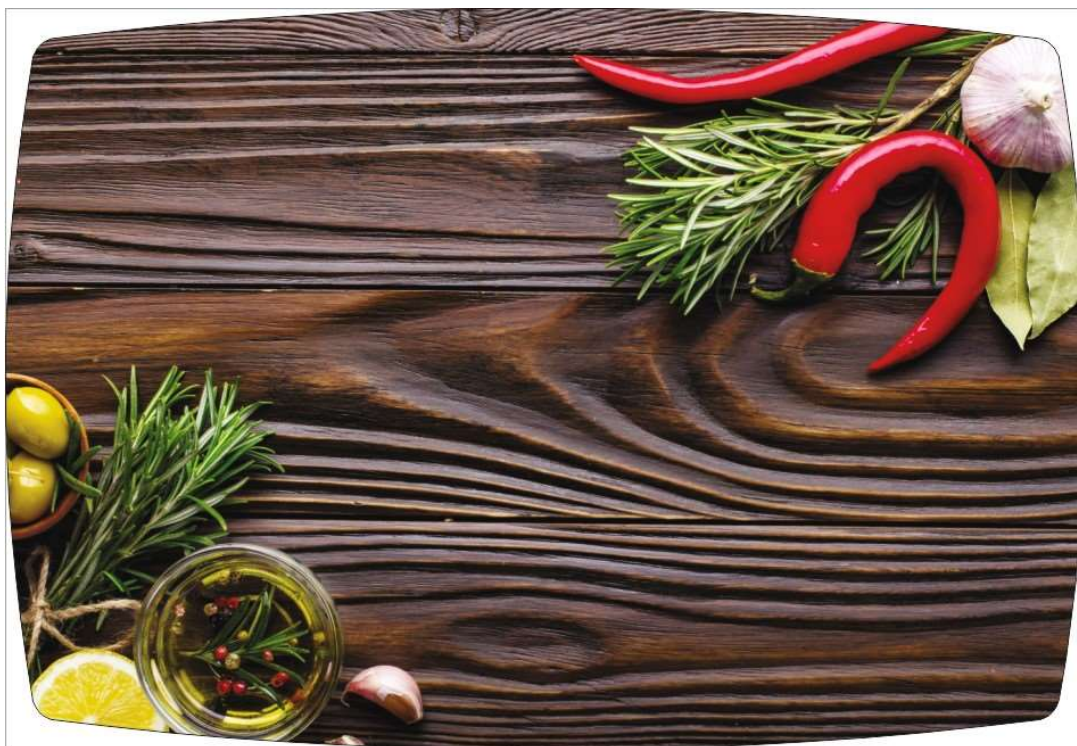
Рисунок 3: РОЗМАРИ