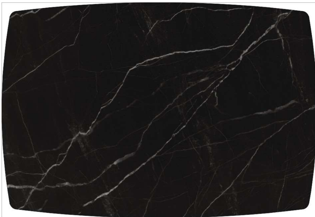
Рисунок 5: ЧЁРНЫЙ МРАМОР