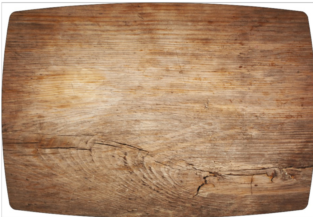
Рисунок 1: ДУБ НАТУРАЛЬНЫЙ