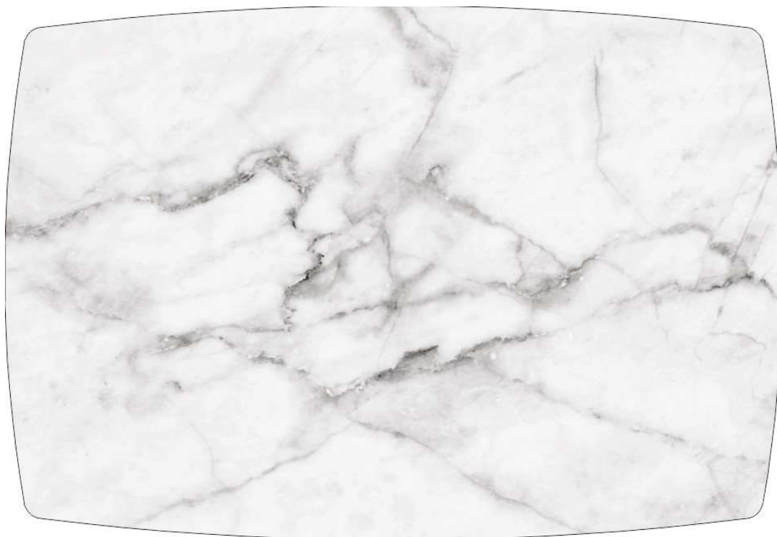
Рисунок 6: БЕЛЫЙ МРАМОР