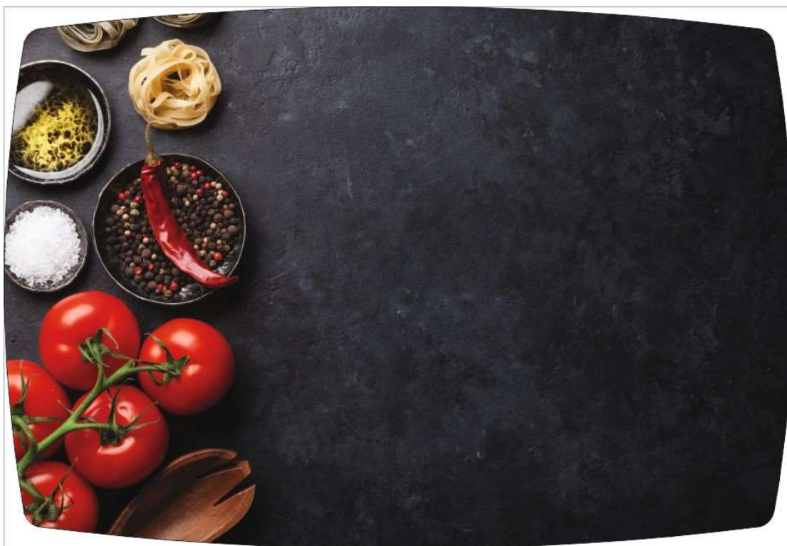
Рисунок 4: PEPPER MIX