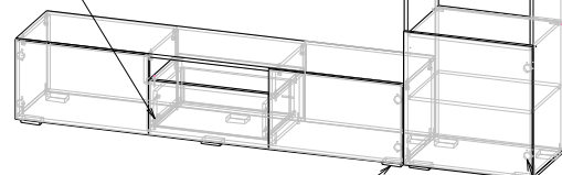
ножка 88*54*20 мм № 1 металл